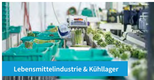
Lebensmittelindustrie & Kühllager